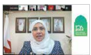
د. هدا السعيد

شاركت الرئيس التنفيذي لهيئة جودة التعليم والتدريب الدكتور جواهر شاهين المضحي في المنتدى الافتراضي الأول لرابطة هيئات ضمان الجودة في دول العالم الإسلامي، اعتماد التعليم العالي في ظل جائحة كوفيد-١٩، الفرص والتحديات، وصقلها منبراً للجلسة الرئيسية للمنتدى، والتي دارت مناقشتها حول اعتماد التعليم العالي: البقاء في زمن كوفيد-١٩، وذلك عبر منصة التواصل عن بعد يوم الثلاثاء الموافق ٢٠١١ ديسمبر ٢٠١١. وتمتلك كل ما يسهم في دعم النقل التعليمي العالي بين الجامعات في دول العالم الإسلامي، اعتماد التعليم العالي في ظل الظروف الحالية تحديات من شأنها أن تطحن من تحقيق الأهداف ومخرجاتها. وقد بدأت الجلسة بكلمة افتتاحية ألقاها البروفيسور فاشان بصر إنباري رئيس رابطة هيئات ضمان الجودة في دول العالم الإسلامي، رئيس هيئة الاعتماد الوطني للتعليم العالي في البحرين، لتتلى مشاركة نخبة من المحاضرين من مختلف أنحاء العالم الإسلامي الدكتور سهيل بن سالم باجمال الرئيس التنفيذي للمركز الوطني للتقويم والاعتماد الأكاديمي