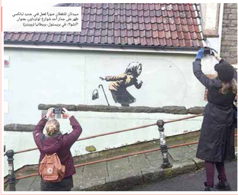
سيدتان تلتقطان صورة لعلف في جديد لباتنسي ظهر على جدار أحد شوارع توترايدون، بعنوان "أنتوا!!"، في بريستون، بريطانيا