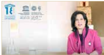
الشيخة مي بنت محمد آل خليفة

الإنسانية كالاقتصاد والاجتماع والسياسة والقانون وغيرها. وتتمنى صلاح فضل أن تواكب مجامع اللغة العربية التطورات المتسارعة في مجال العلوم الطبيعية والإنسانية والفنون والآداب إضافة إلى العمل؛ من أجل إدخال مصادر اللغة العربية في كتب ومعاجم إلى العالم الرقمي الذي يشهد ثورة كبيرة، داعياً كافة المؤسسات العربية والعالمية إلى أن تساهم في رفعة هذه المعارف والمصادر لكي يستفيد منها الباحثون والطلاب والراغبون في تطوير لغتهم العربية من كافة أنحاء العالم.