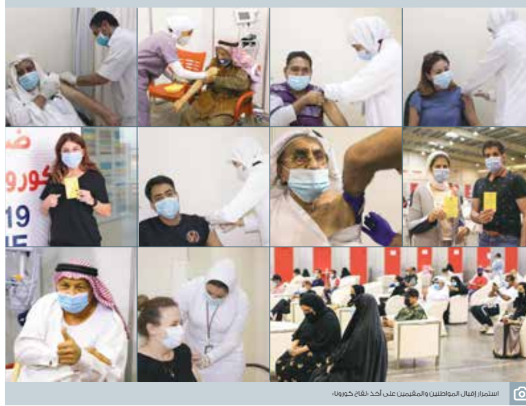
استمرار إقبال المواطنين والمقيمين على أحد فروع كورونا