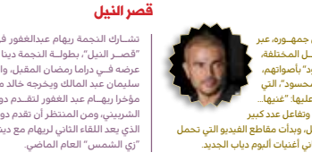
رسالة إلى جمهوره