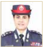
العميد منى عبدالرحيم

أكدت مدير عام الإدارة العامة للشرطة النسائية، العميد منى عبدالرحيم أن الشرطة النسائية عملت على خدمة المجتمع وحماية كل المواطنين، خاصة النساء والأطفال والشباب. وأوضحت، في مقال نشره موقع مركز ويلسون بالولايات المتحدة بمناسبة الاحتفال بمرور 50 عاماً على تأسيس الشرطة النسائية بعملة البحرين، واستعرضت فيه جانباً من مسيرة عطاء الشرطة النسائية في مجالات عدة، أن البحرين من أوائل الدول العربية التي شكلت الشرطة النسائية، وأنها رائدة في هذا المجال بمنطقة الخليج وتواصل ابتكار تغييرات فعالة في مجال رعاية المرأة والأطفال والشباب. وأضافت أن الشرطة النسائية البحرينية، لعبت دوراً مهماً في تأسيس قوة الشرطة النسائية في دولة الكويت منذ 2008 إلى 2012، حيث عملت مستشارة لتدريب الشرطة في تشكيل القوة، كما ساهمت في نجاح البحرين بمكافحة الجرائم ضد الأطفال والنساء.